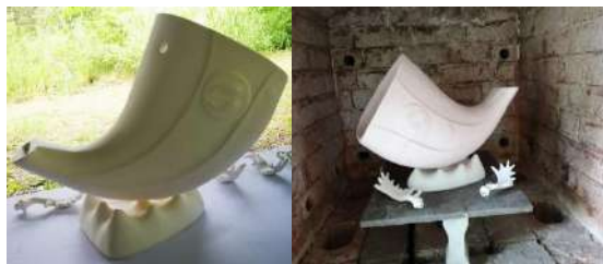
ภาพที่ 11 แสดงชิ้นงานเมื่อผ่านกระบวนการทางความร้อนที่อุณหภูมิ 800 องศาเซียสยังมีการดูดซึมน้ำได้อยู่