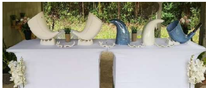
ภาพที่ 13 ภาพรวมผลิตภัณฑ์เซรามิกจากต่อเขาควายแข็ง