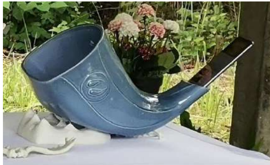
ภาพที่ 12 แสดงชิ้นงานเมื่อผ่านกระบวนการทางความร้อนที่อุณหภูมิ 1,200 องศาเซียส ไม่ดูดซึมน้ำและผลิตภัณฑ์ที่มีความแข็งแรงมากที่สุดในสามระดับอุณหภูมิ