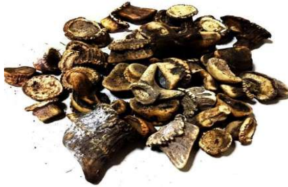
ภาพที่ 1 ตอเขากวางแห้ง