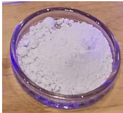
ภาพที่ 4 ผ่านกระบวนการทางความร้อนที่ 1,000 องศาเซลเซียส บดให้ละเอียดจึงนำมากรองด้วยตะแกรงร้อน

1.4 ล้างด้วยน้ำสะอาด เพื่อให้สิ่งสกปรก และ ความเป็นด่างหมดไป เพราะความเป็นด่างจะทำให้ช่วง การเผาไหม้