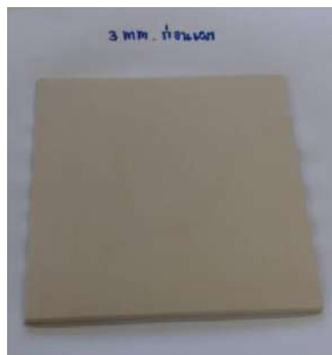
ภาพที่ 6 แผ่นทดสอบเมื่อนำออกจากแบบพิมพ์ปูนปลาสเตอร์

2.5 นำแผ่นทดสอบออกจากแบบพิมพ์ปูนปลาสเตอร์แล้วนำไปอบที่เตาอบ เพื่อให้แผ่นทดสอบไม่มีความชื้นจึงนำไปผ่านกระบวนการทางความร้อน