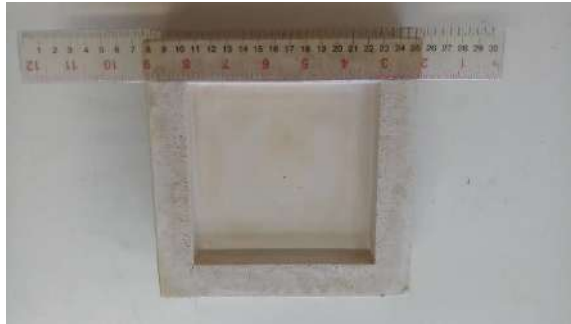
ภาพที่ 5 แบบพิมพ์ปูนปลาสเตอร์

2.3 นำสารตั้งต้นมาผสมกับดินตามอัตราส่วนตามสูตร คิดเป็นร้อยละ