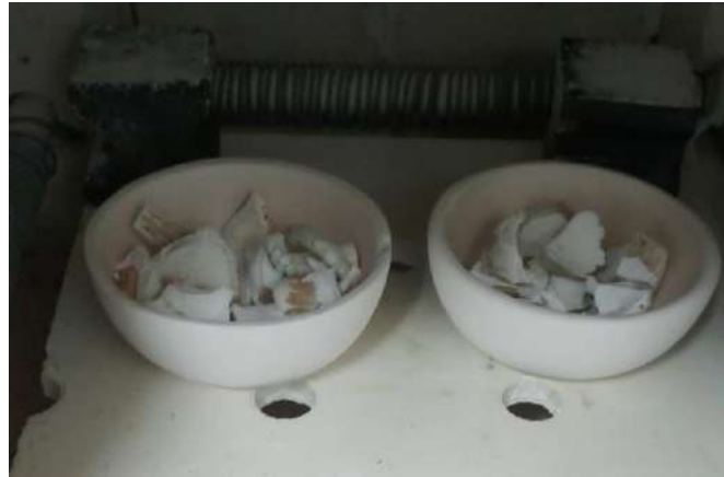
ภาพที่ 3 ตอเขากวางแข็งเมื่อผ่านกระบวนการทางความร้อน