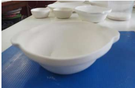
ภาพที่ 10 เมื่อผ่านกระบวนการทางความร้อนที่อุณหภูมิ 1,200 องศาเซลเซียส เนื้อดินจะเป็นสีขาวมากที่สุด