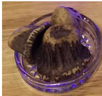
ภาพที่ 2 ตอเขากวางที่จะนำไปทำความสะอาด

แช่ 1 ชั่วโมง ทำให้เศษเนื้อนุ่มและง่ายต่อการแกะ จากนั้นนำไปต้มน้ำเดือด อุณหภูมิ 100 องศาเซลเซียส ใช้เวลาในการต้ม 6 ชม. จึงนำออกมาทำความสะอาดอีกครั้งทุบเอาไช้กระดูกออก ขจัดโปรตีนออกให้ได้มากที่สุด