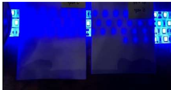
ภาพที่ 8 เปรียบเทียบความโปร่งแสงขั้วมือโบนไซขนาดต้นแบบและขั้วมือสารตั้งต้น 30 เปอร์เซ็นต์ เนื้อดิน 70