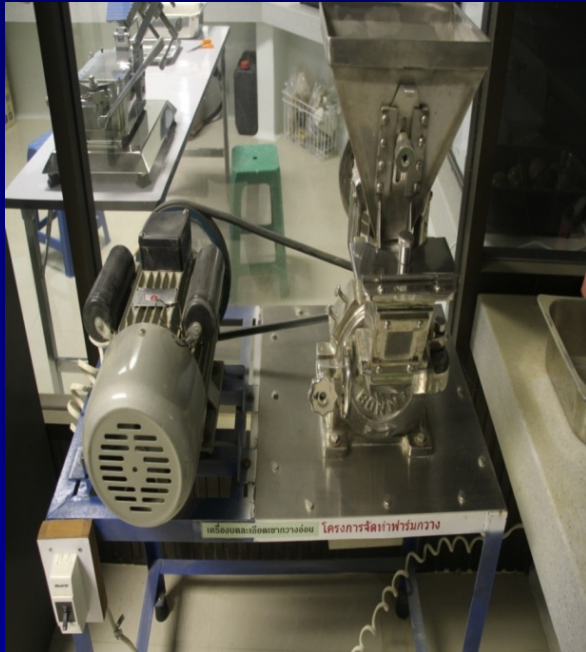
เครื่องบดละเอียด