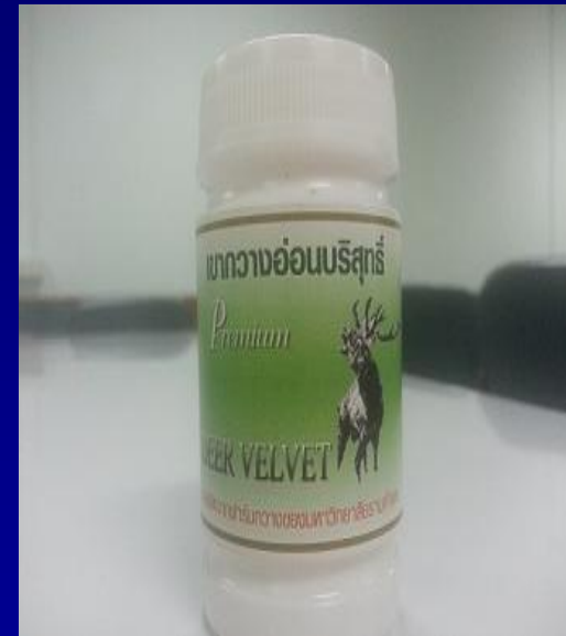
ฉลากผลิตภัณฑ์