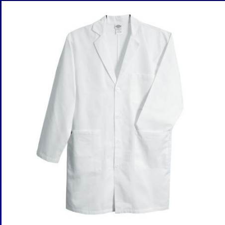
เสื้อคลุม