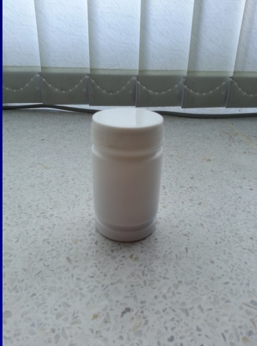
ขวดบรรจุผลิตภัณฑ์