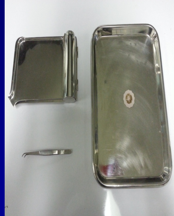
ภาชนะและอุปกรณ์สำหรับบรรจุ