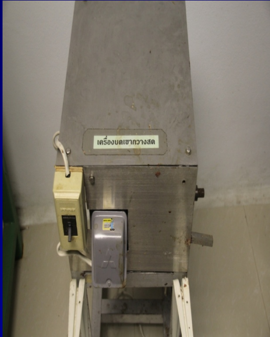
เครื่องอบหยาบ