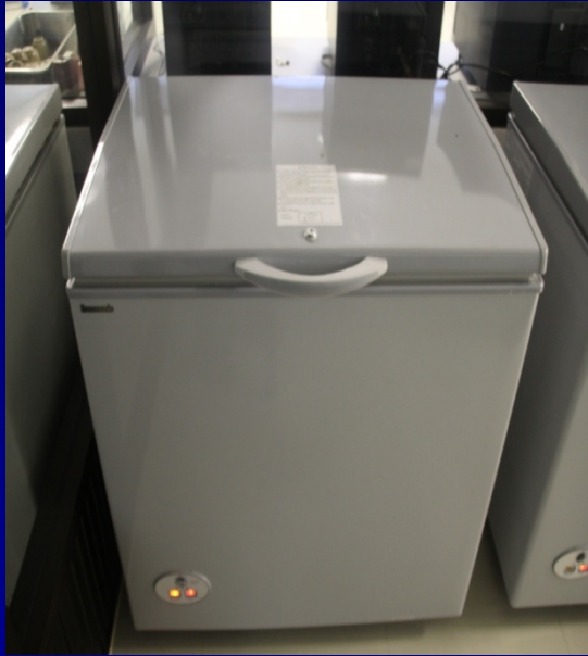
ตู้แช่แข็ง