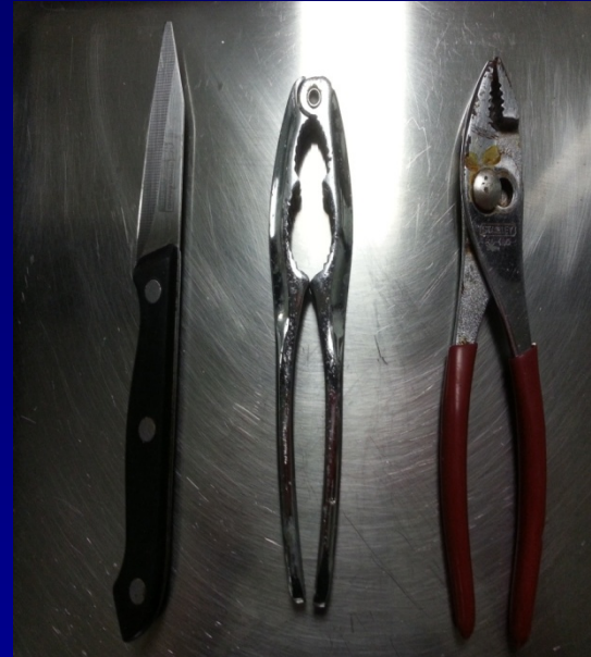
มีดและอุปกรณ์หยิบจับ