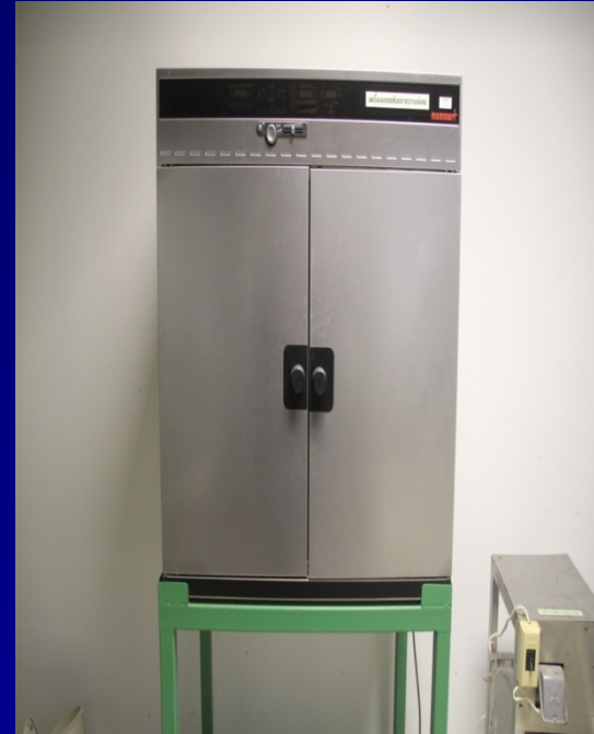
ตู้อบแห้ง