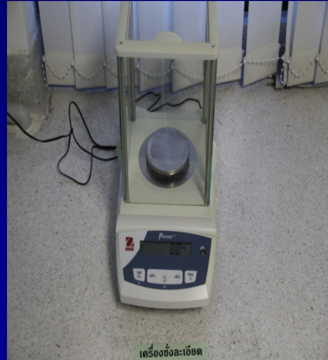
เครื่องชั่งละเอียด